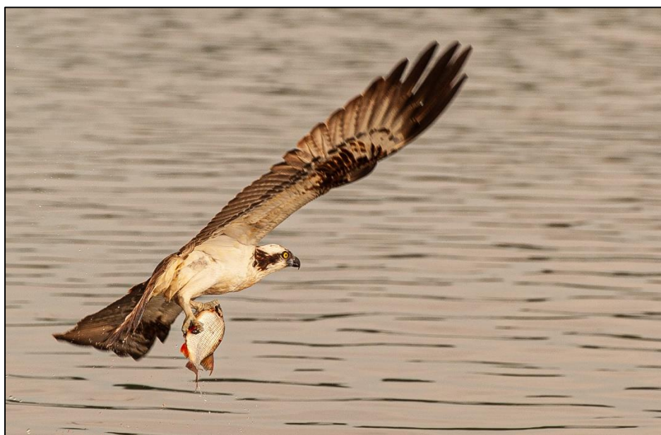
Fiskgjuse med fångst över Västra Ringsjön

Under 2024 är målet att hålla minst två offentliga sammankomster. Uppskattad kostnad för detta är 30 tkr. Insatsen finansieras genom balanskontot, under förutsättning att beslut fattas av huvudmännen om att godkänna detta.